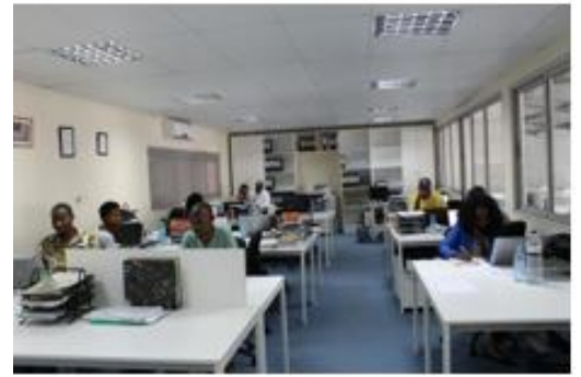
Fig. 2. Offices

公司正在筹集 1000 万美元股权资本用于占比达 30% 的业务，以加快将“农户之家”农业枢纽和零售店扩展到莫桑比克全部省份——投资新店面设施、资本性支出 (CAPEX) 和运营成本 (OPEX)。这笔资金将得到另一笔 1000 万美元贷款的补充。公司计划在全国发展品牌和“Casa do Agricultor - 农户之家”理念，以便为客户提供解决方案和激励，让他们能购买投入品，获得技术援助和使用机械化，并帮助他们找到适合自己产品的市场。公司希望在未来 36 个月内开设另外 10 个农业枢纽和 20 个店面，速度分别为每年 10 个 (2018 年)、12 个 (2019 年)、8 个 (2020 年)。