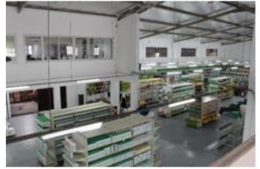
Fig. 1. Storage house